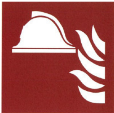
Mittel und Geräte zur Brandbekämpfung