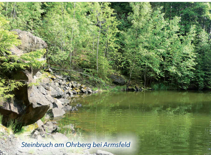
Steinbruch am Ohrberg bei Armsfeld

Drei kurze Rundtouren kann man von hier in die umgebende Kulturlandschaft unternehmen: Rundweg ❶ führt auf einem Lehrpfad durch Wacholderheiden und erlaubt immer wieder neue Blicke ins Urfftal und den Kellerwald. Rundweg ❷ führt rund um den Ohrberg. Hier lohnt ein kleiner Abstecher zu einem alten Diabas-Steinbruch mit einem grünen Teich, eine Oase der Stille. Im Kohlbachtal auf Rundweg ❸ lassen Vertiefungen die Spuren des Eisenerz-Abbaus in alten Zeiten erahnen.