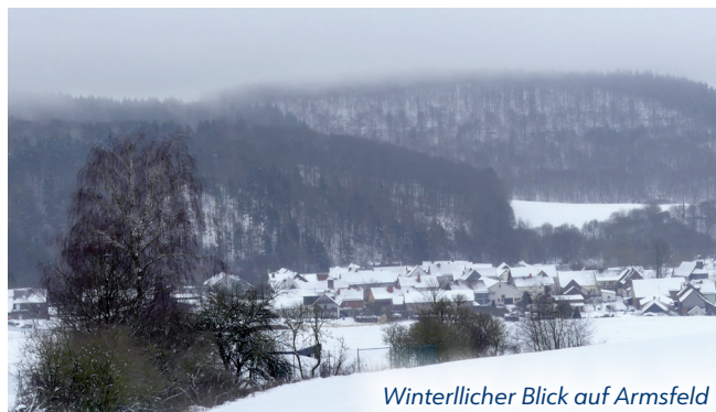
Winterlicher Blick auf Armsfeld

Sehenswürdigkeiten: Historisches Bergamt, Besucherbergwerk (alte Kupfermine), Schneewittchenhaus und Edelsteinschleiferei in Bergfreiheit, und in Armsfeld der Pferdehof Silber-Ranch sowie die fast 500 Jahre alte Kirche.