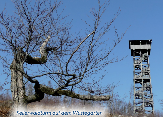
Kellerwaldturm auf dem Wüstegarten

Die beiden Bad Wildunger Ortsteile Armsfeld und Bergfreiheit sind geprägt vom Bergbau vergangener Jahrhunderte, schönen Ortskernen mit alten Fachwerkhäusern sowie einer äußerst abwechslungsreichen Landschaft.