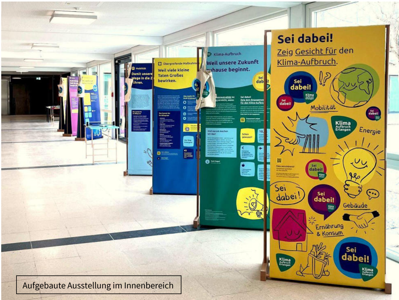
Aufgebaute Ausstellung im Innenbereich