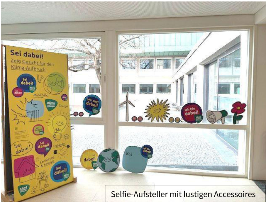
Selfie-Aufsteller mit lustigen Accessoires