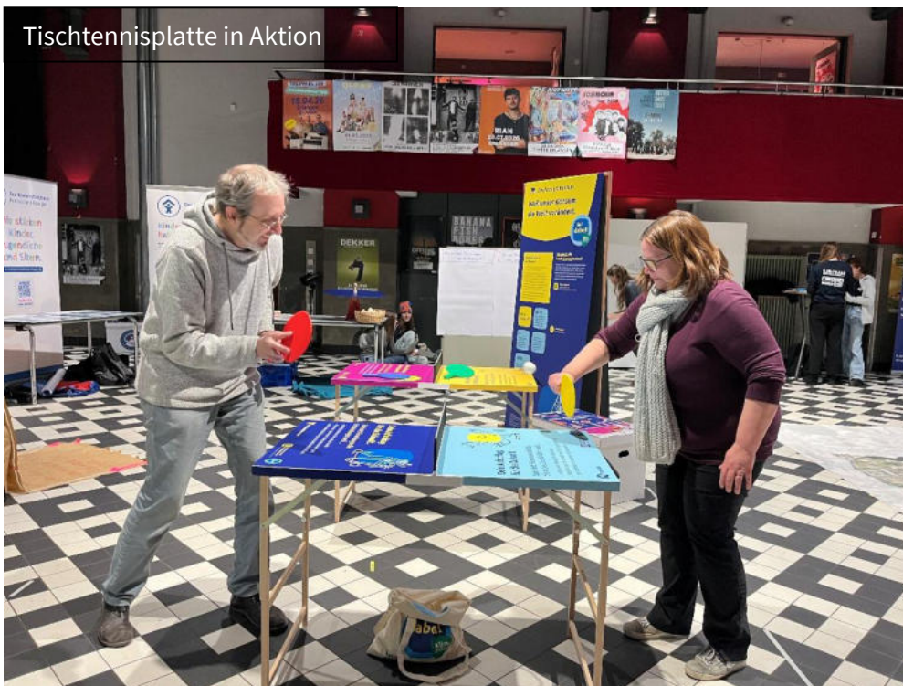
Tischtennisplatte in Aktion