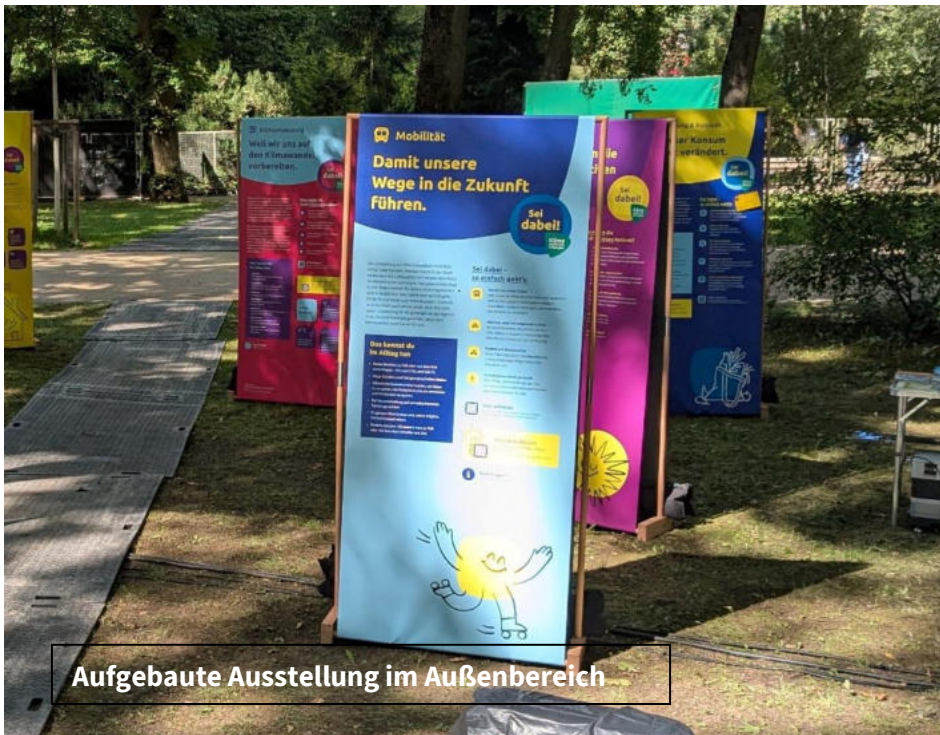
Aufgebaute Ausstellung im Außenbereich