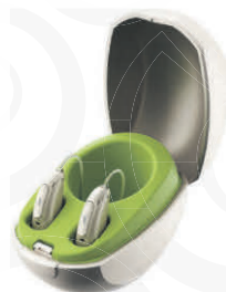
Phonak Audeo Marvel-Akku-Technik