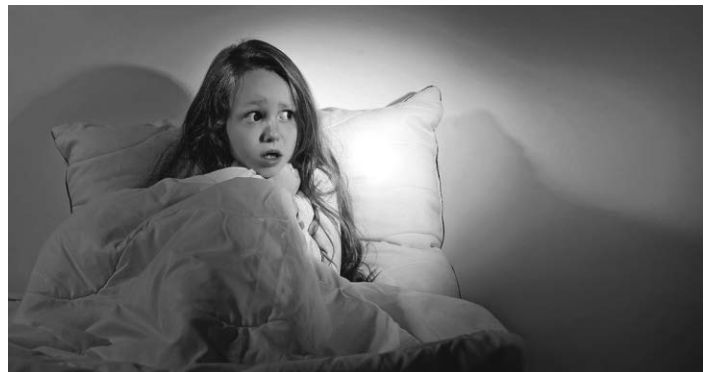
Viele Eltern kennen es: Sobald abends das Licht aus ist, bekommen Kinder Angst und wollen nicht mehr im eigenen Bett schlafen.

Die 21 Familientreffs im Bodenseekreis veranstalten jährlich mehr als 100 Vorträge zu familienrelevanten Themen. Alle Informationen, weitere Vorträge und Online-Angebote für Eltern, Familien und Erziehende gibt es unter www.bodenseekreis.de/soziales-gesundheit/familie-kinder/familientreffs/