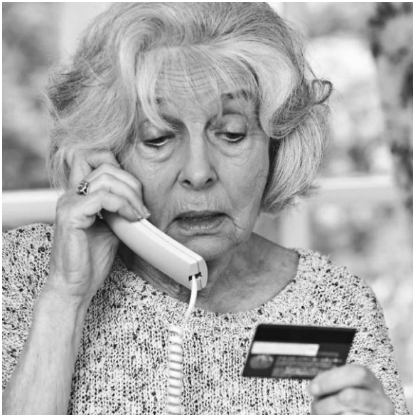
Der Anruf eines vermeintlichen IT-Beraters oder sogenannte Schockanrufe gehören zu den Betrugsmaschen.