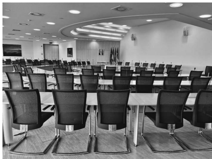
Die Kreistagssitzungen finden im Sänktissaal des Landratsamtes statt.

https://www.bodenseekreis.de/politik-verwaltung/bekanntmachungen/