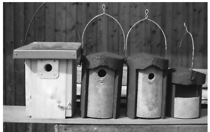
Nistkästen_Foto NABU Eriskirch-Mecklenbeuren

Bedingt durch den abnehmenden Bestand an Singvögeln und Fledermäusen, führt der NABU Eriskirch-Mecklenbeuren wieder eine Förderaktion von Nisthilfen für Singvögel durch. Am Samstag 17.02.2024 werden um 10:00 Uhr in Eriskirch, Dillmannshof 15 -so lange der Vorrat reicht- sehr robuste Holzbeton- und Holz-Nisthöhlen mit Flugloch-Ø32 mm und Ø28 mm und Bausätze aus Holz kostenlos abgegeben. Eine Spende ist erwünscht. Ermöglicht wird diese Aktion u.a. durch die vorbildliche Unterstützung durch FENEBERG in Mecklenbeuren und allen, die dort einkaufen und ihren Einkaufsbeleg durch den/die Kassierer*in abgestempelt in die Sammelbox am Zaun schräg gegenüber am Bahnhof einwerfen. Herzlichen Dank dafür!