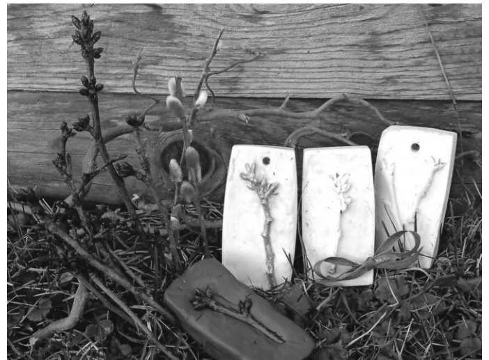
Knospenabdrücke, T. Clemens

Teilnahme nur nach Anmeldung, die Veranstaltung findet bei jeder Witterung statt.