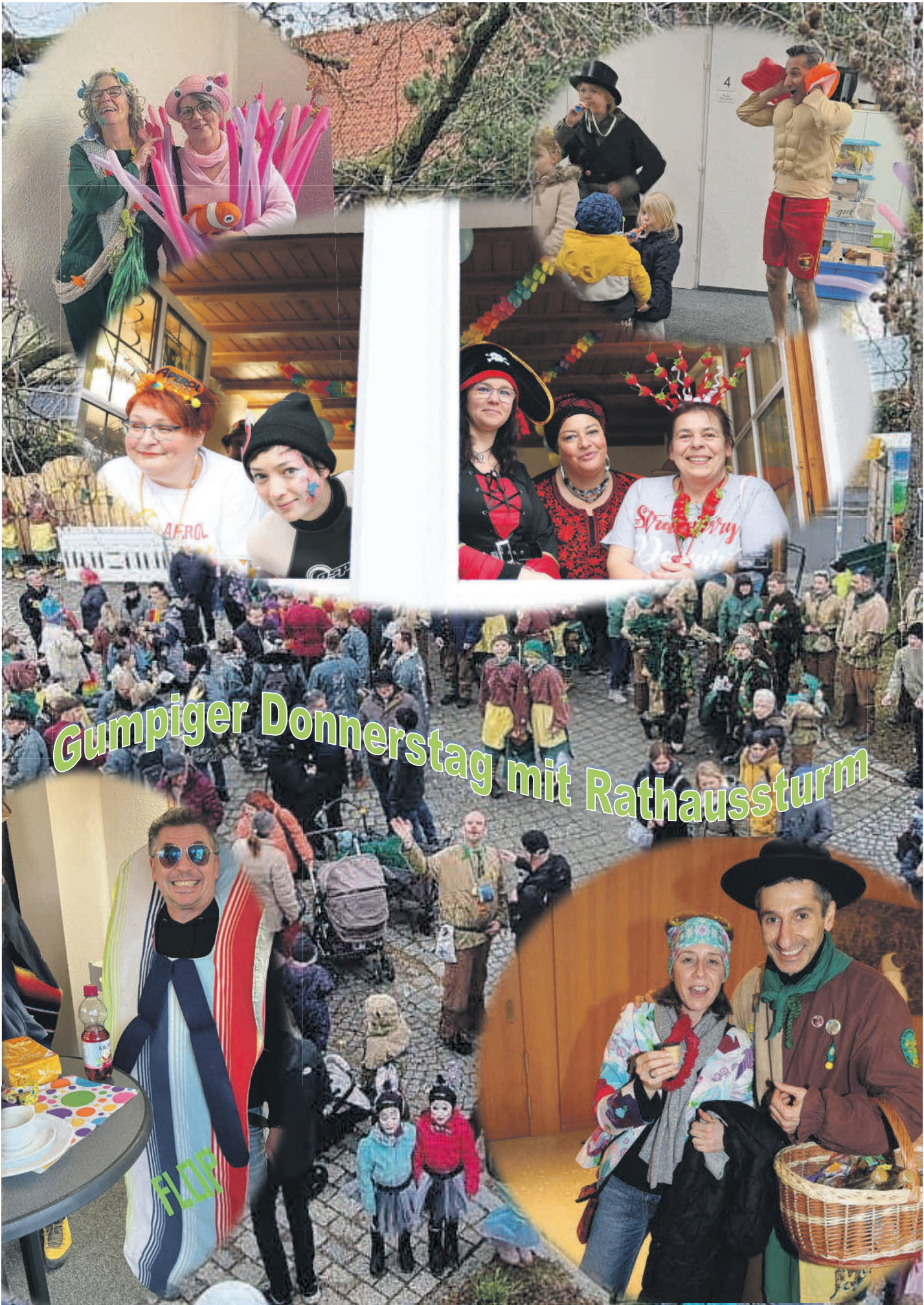
Gumpiger Donnerstag mit Rathaussturm