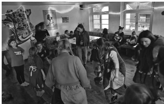
Impressionen vom Kinderhausball

Am Freitag, den 02.02.2024 fand von 15.30 bis 18.00 Uhr der Kinderball in unserem Zunftheim statt. Zuerst stärkten sich die „kleinen und großen Hexen 2 mit Kuchen und Muffins. Frisch gestärkt konnte der Ball dann beginnen. Die Kids hatten großen Spaß an den vorbereiteten Spielen. Manche Spiele waren ganz nett anstrengend. Da man sich nicht hungrig auf dem Heimweg machen