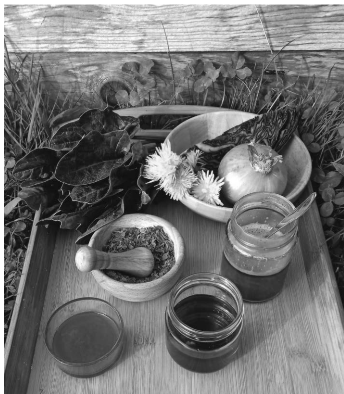
Farben aus Pflanzen

Die Aktion ist kostenfrei, eine kleine Spende ist willkommen. Die Teilnahme ist nur nach Anmeldung möglich. Die Veranstaltung findet nur bei trockener Witterung statt.