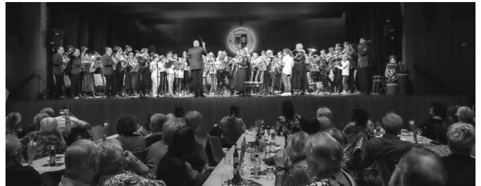
Der gemeinsame Abschluss