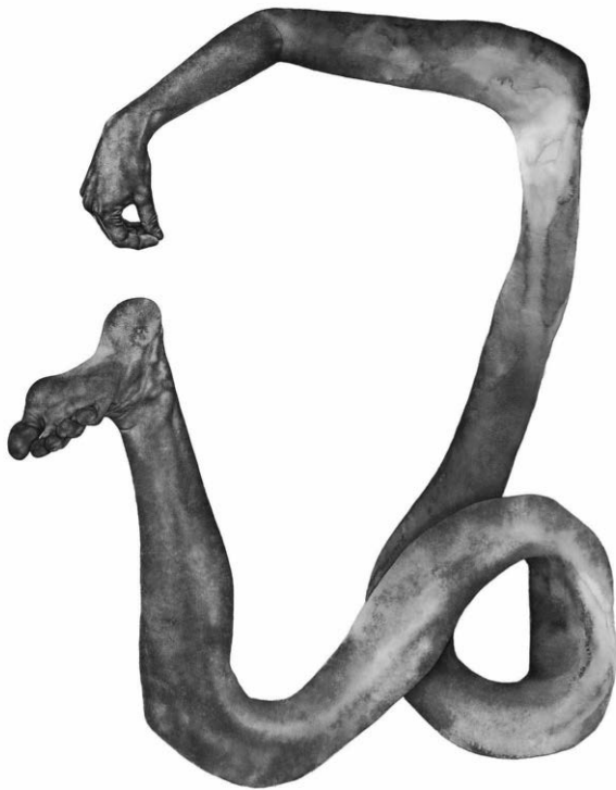
Gemälde: Rebekka Berthold, Sinkflug, 2022 / © Rebekka Berthold, teilnehmende Künstlerin in der Förderpreis-Ausstellung ZUR SACHE!

https://www.bodenseekreis.de/bildung-kultur/kultur/galerie-bodenseekreis/ausstellungen