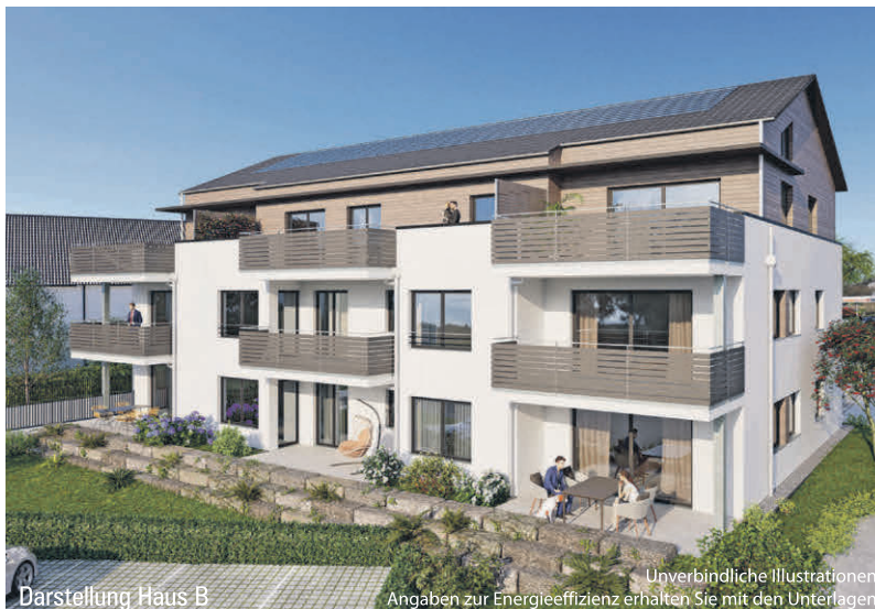
Darstellung Haus B

Unverbindliche Illustrationen Angaben zur Energieeffizienz erhalten Sie mit den Unterlagen