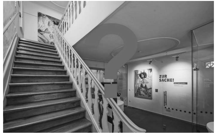
Auf die Spürnasen wartet eine Schnitzeljagd mit spannenden Hinweisen und kniffligen Rätseln.

Die Schnitzeljagd findet im Rahmen der Förderpreis-Ausstellung ZUR SACHE! statt. Dort zeigen 32 junge Künstlerinnen und Künstler gegenständliche Gemälde und Zeichnungen. Mit ihren Werken bewerben sie sich um den begehrten Förderpreis des Bodenseekreises jung + gegenständlich. https://www.bodenseekreis.de/bildung-kultur/kultur/galerie-bodenseekreis/ausstellungen