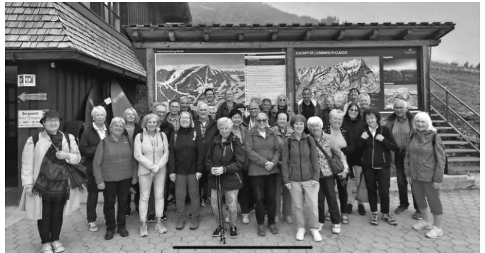
Gruppenfoto an der Bergstation