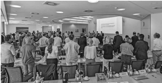
60 Kreisräte wurden am 23. Juli in der konstituierenden Sitzung des Kreistags verpflichtet. Zwei weitere Mitglieder folgen noch bei der nächsten Kreistagssitzung am 22. Oktober.

Im neuen Kreistag stellt die CDU mit 18 Sitzen die stärkste Fraktion. Die Freien Wähler haben 14, die Grünen 9, die AFD 7, die SPD 6 und die FDP 3 Sitze sowie die Oberteuringer Liste und Eriskircher Liste mit je einem Sitz. Die Linke wird ebenso mit einem Sitz vertreten sein. Neu im Kreistag mit ebenso je einem Sitz sind das Netzwerk für Friedrichshafen und die Freie Liste Bodensee. Die Kreisrätinnen und Kreisräte sind für eine Amtszeit von fünf Jahren bis 2029 gewählt.