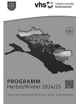
Das Cover-Bild des neuen Programmheftes.

Anmeldung und weitere Informationen zu den Kursen unter Tel. 07541 204-5425, -5246, -5468 und -5431 sowie www.vhs-bodenseekreis.de .