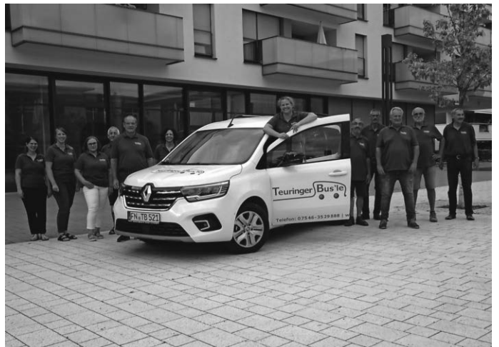
Bürgerbus Oberteuringen