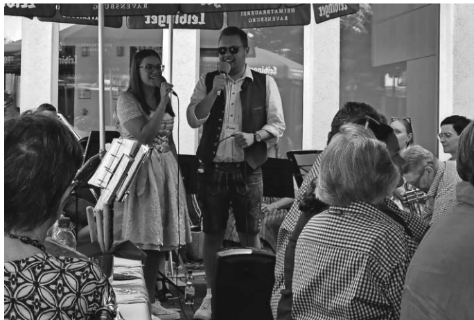
Frech-fröhliche Wirtshauslieder aus dem Alpenraum trug ein „Gstanzl-Duo“ vor.