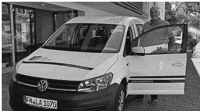
Bürgerbus SoFa Langenargen