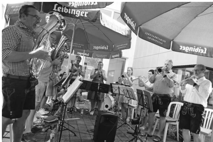
Jedes Jahr beim Sommerfest im Haus der Pflege St. Iris mit dabei: Die Musikkapelle Eriskirch.