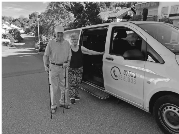
Bürgerbus Linzgau Shuttle Salem Frickingen

Einige Bürgerbusse suchen noch ehrenamtliche Helfer und Fahrer. Infos dazu gibt es in der Freiwilligenbörse „Engagiert am See“: https://engagiert-am-see.de/