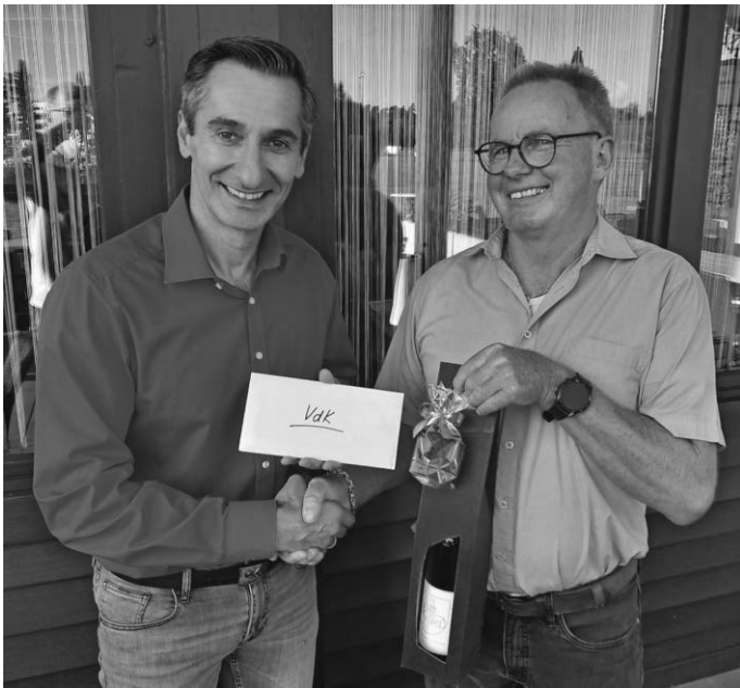
Geschenke der Gemeinde Eriskirch