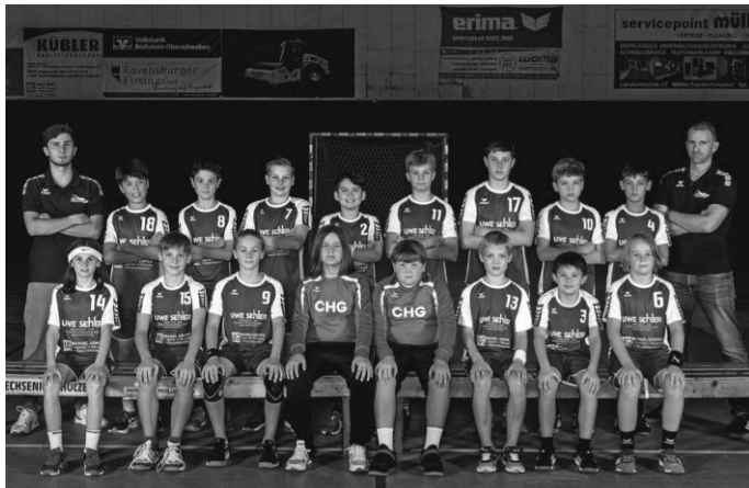
Mannschaftsfoto Saison 2024/2025