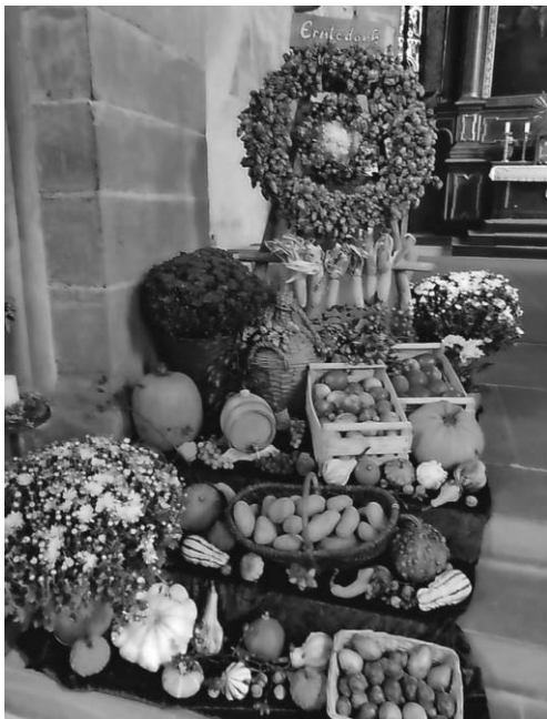
Erntedankaltar in Eriskirch

Euch allen ein herzliches Vergelt's Gott.