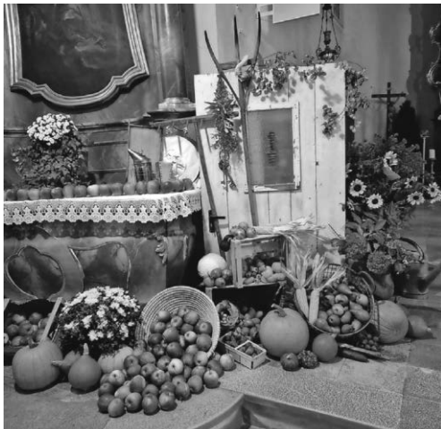
Erntedankaltar in Mariabrunn