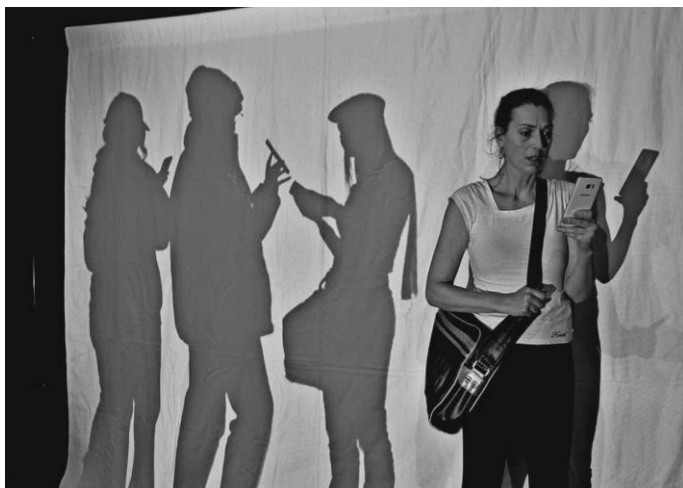
Eine Momentaufnahme aus dem Präventionstheater „Hop oder Top! Alles cyber, oder was?“