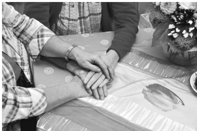
Vor allem in der Grünen Branche werden besonders viele Angehörige zu Hause gepflegt.