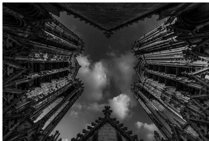
„Kathedrale in Reims“, Dominique Grube