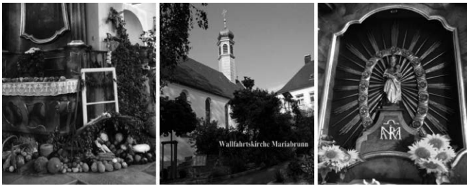
Wallfahrtsandacht in Mariabrunn am 06. Oktober 2024 um 14.00 Uhr mit Segnung der Erntegaben Musik: Kirchenchor Mariabrunn Danach lädt der Kirchenchor zu Kaffee + Kuchen ein