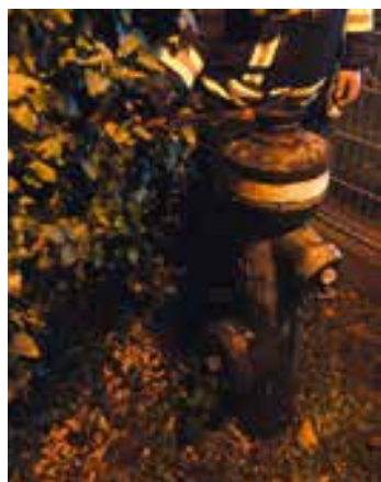
Eine angrenzende Hecke verhindert ein schnelles Öffnen des Hydranten

Achten Sie doch einmal auf die Hydranten in Ihrer Nachbarschaft und befreien Sie diese bei Bedarf von störenden Gewächsen und Einfriedungen, damit die Einsatzkräfte im Ernstfall schnellstmöglich an Wassernachschub kommen können.