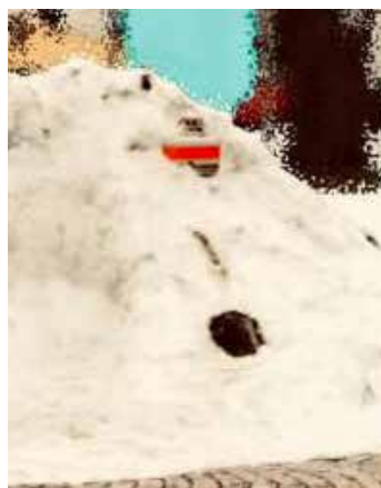
Unter Schneemassen nahezu vollständig vergrabener Hydrant

Wir wünschen Ihnen eine frohe Advents- und Weihnachtszeit, ruhige und besinnliche Tage und einen guten Start in das neue, bevorstehende Jahr! Bitte lassen Sie dabei Kerzen niemals unbeaufsichtigt, sorgen für ausreichend Löschmöglichkeiten oder steigen direkt auf elektrischen Weihnachtsschmuck um.