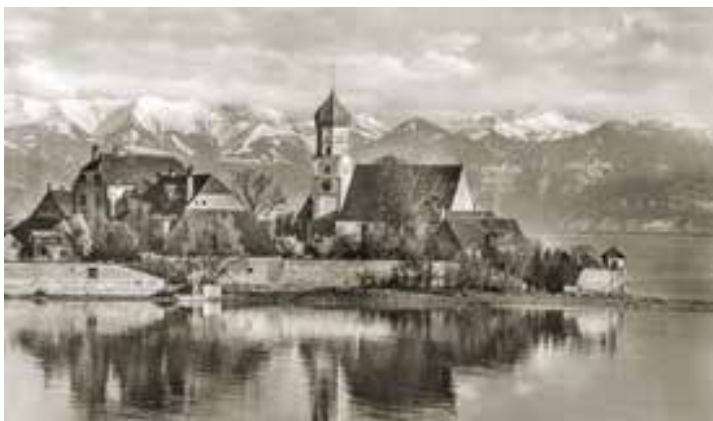
Historische Ansichten aus WASSERBURG Ein Bildkalender für das Jahr 2024

Egal ob als Geschenk für einen lieben Menschen, oder für sich selbst. Der historische Bildkalender 2024 ist ab sofort in der Tourist-Information Wasserburg für 19,90 € erhältlich.