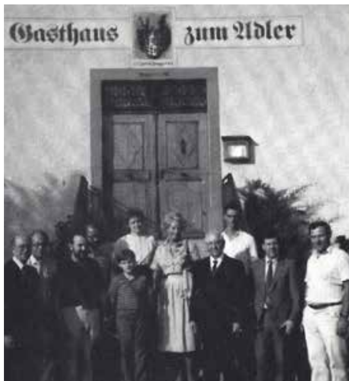
Besuch der Familie Fugger im Festjahr 1984

Poststation im heutigen Gasthof Adler ein, eine andere Linie betrieb erfolgreichen Weinhandel in Wasserburg. Ein berühmter Spross der Familie Greising war der Barockbaumeister Josef Greising, der als Ausbilder von Balthasar Neumann gilt.